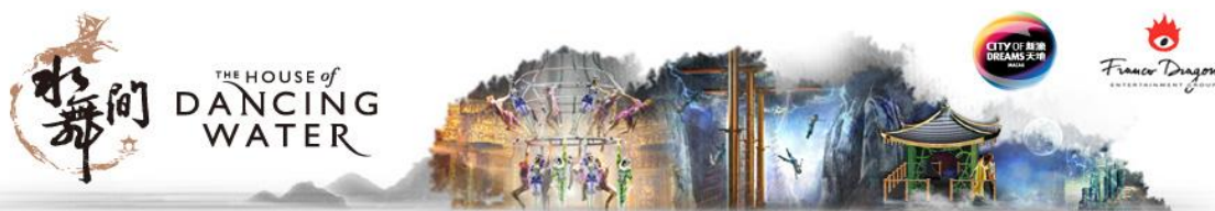
The House of dancing water 水舞間